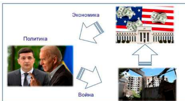
Рис. 1. Зависимость политики и войны от экономических интересов

Таким образом, экономика формирует политический заказ, политика реализует планы банков и промышленников, прежде всего оружейного лобби, которые жаждут войны, а война в конечном итоге питает ту самую экономику (рисунок 1).